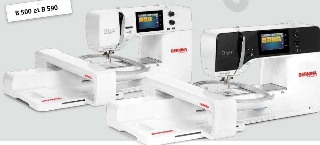
B 500 et B 590

Qu'est-ce que des artistes de cosplay extrêmement talentueux adorent dans la machine B 590 ? Tout. Elle est incroyablement rapide. Elle est suffisamment puissante pour travailler avec des matières originales. Ses fonctionnalités de broderies sont quasi-illimitées. Les cosplayers sont fascinés par cette machine. Vous aussi vous allez l'adorer!