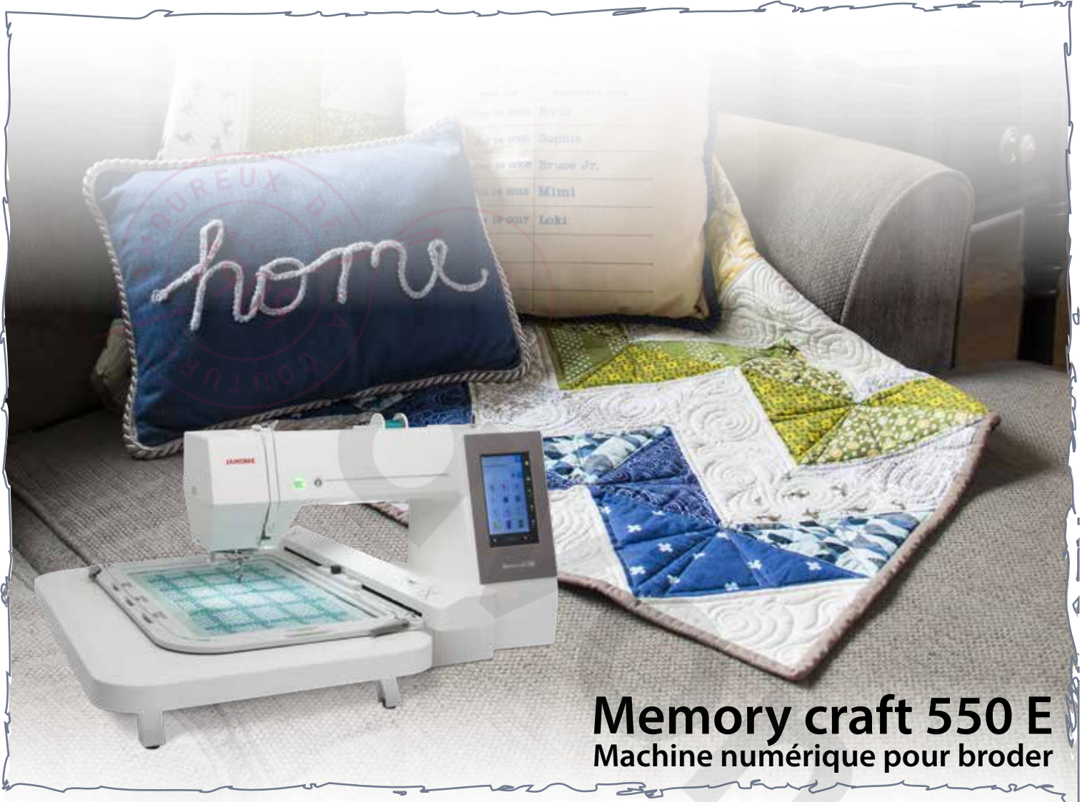
Memory craft 550 E Machine numérique pour broder