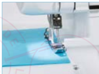
Eclairage par LED du plan de travail