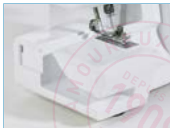
Bras libre et plan de travail extra-plat