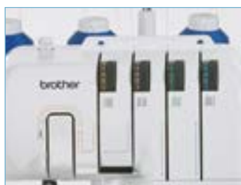
Guide d'enfilage avec repères en 4 couleurs