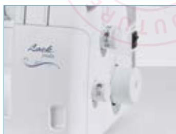
Accès simplifié aux réglages