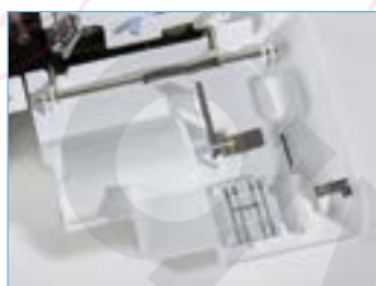
Rangement astucieux des accessoires